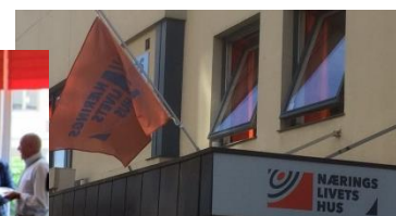
Næringslivets Hus ble åpnet 11. juni 2015.