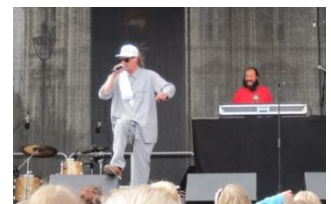
Admiral P på Søndre Torv under midtsommerkonserten

I tillegg ble aktivitets – og treningsparken etablert i Søndre Park i samarbeid med Ringerike Utvikling, Ringerike Kommune og sponsorer.