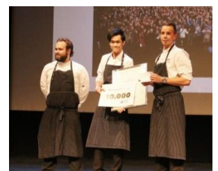
RNFs næringspris 2015 gikk til Brasserie Fengselet.